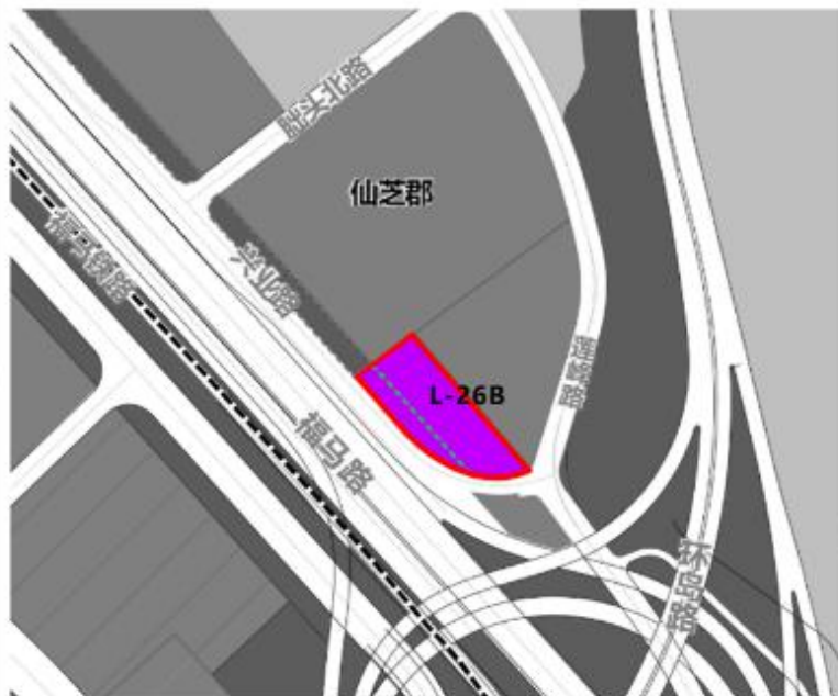
地块控规草案示意图