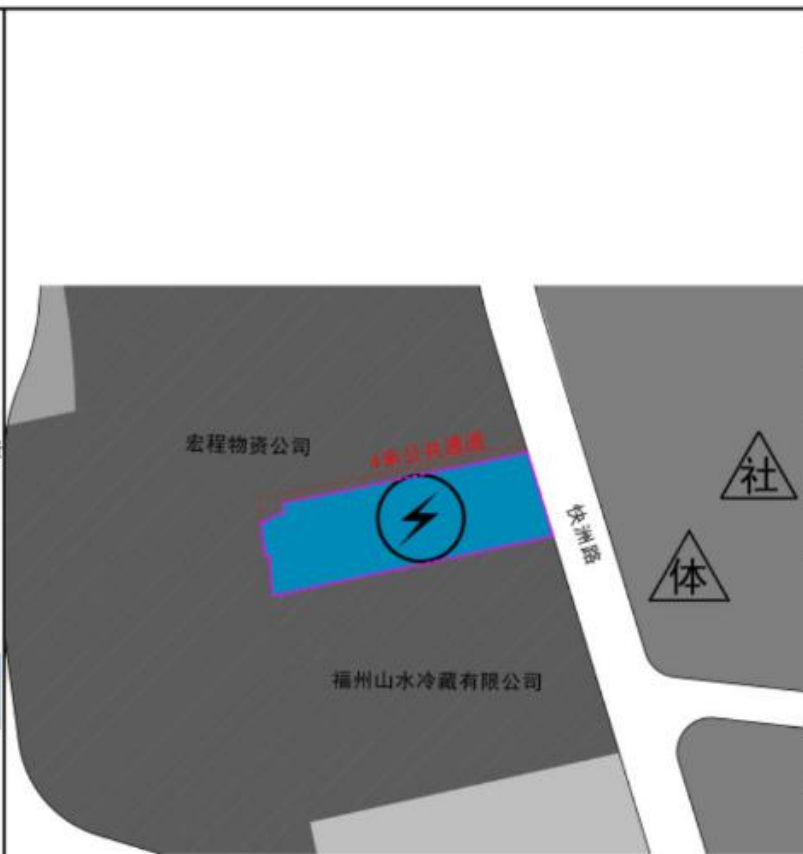
地块控规草案示意图